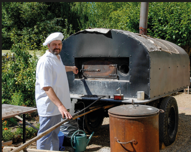
Le jour de l'événement, les boulangers préparent le pain pour le pique-nique du midi et le repas du soir (2007).