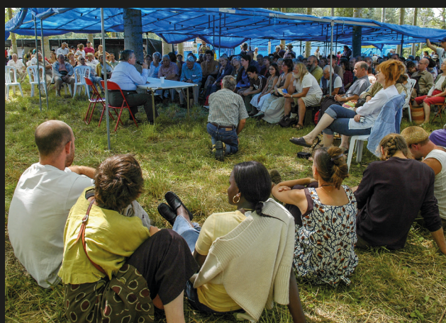
La Fête du blé au pain accueille chaque année en août plus de 6 000 personnes et invite un conférencier.